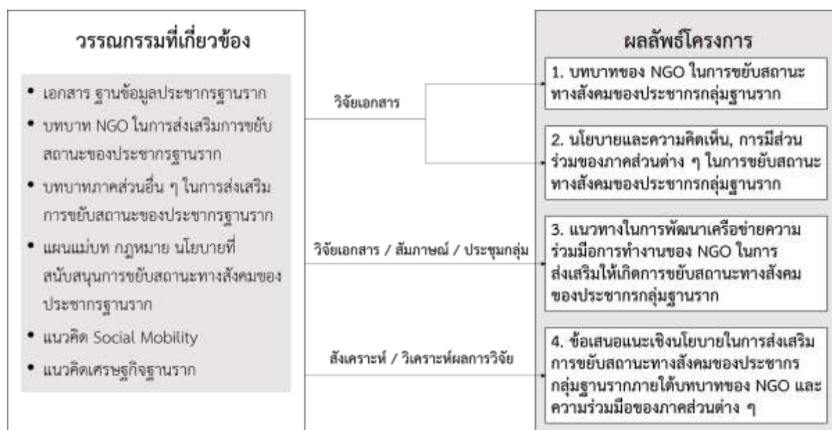
ภาพที่ 3 กรอบแนวคิดในการดำเนินการวิจัย

ส่วนที่ 3 จัดทำข้อเสนอแนะเชิงนโยบาย ในการส่งเสริมการยับยั้งสถานะทางสังคมของประชากรกลุ่มฐานราก ภายใต้บทบาทของ NGOs และ ความร่วมมือของภาคส่วนต่าง ๆ โดยทีมนักวิจัยจะทำการสรุปวิเคราะห์ สังเคราะห์จากผลการศึกษาทุกส่วนก่อนหน้า และนำมาจัดทำเป็นข้อเสนอแนะเชิงนโยบายและกลไกในการส่งเสริมการยับยั้งสถานะทางสังคมของประชากรกลุ่มฐานราก ภายใต้บทบาทของ NGOs และ ความร่วมมือของภาคส่วนต่าง ๆ