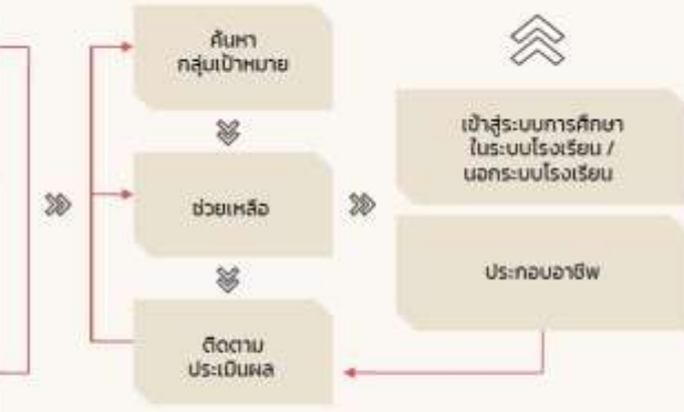
ภาพที่ 6 แผนผังสรุปการดำเนินการตามข้อเสนอแนะเชิงปฏิบัติ