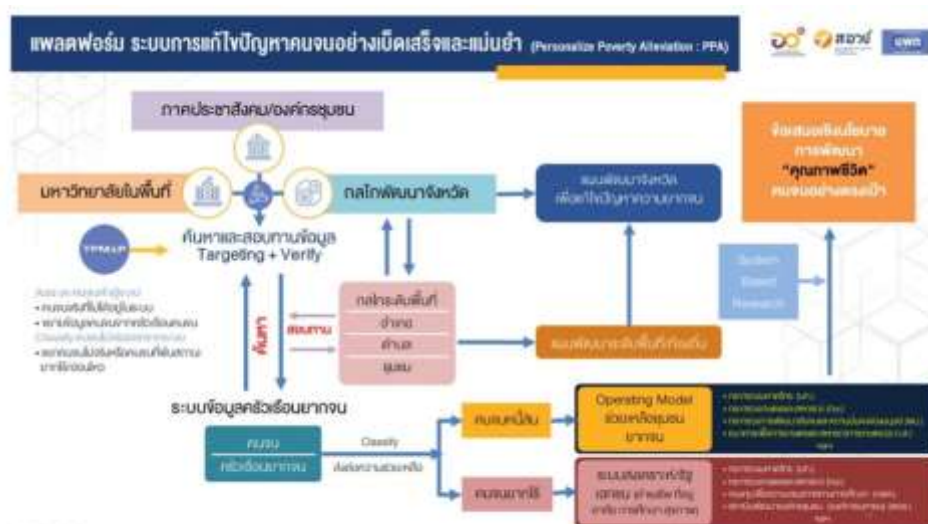
ภาพที่ 2 ระบบแก้ไขปัญหาคนจนอย่างเบ็ดเสร็จและแม่นยำ

โดยทำงานร่วมกับมหาวิทยาลัยในพื้นที่ กระจายกำลังค้นหาคนจนที่ไม่อยู่ในระบบให้เข้าสู่ระบบ และแยกคนไม่จนหรือพ้นความยากจนออกจากระบบ สอบทานข้อมูลกับกลไกและแผนพัฒนาจังหวัดเพื่อแก้ปัญหาความยากจน โดยแบ่งเป็น 2 ประเภทคือ ประเภทที่ 1 คนจนหนี้สิน จะใช้งานวิจัยและนวัตกรรม โมเดลธุรกิจ (business model) ของ หน่วยงานต่าง ๆ เช่น กระทรวงมหาดไทย กระทรวงเกษตรและสหกรณ์ กระทรวงพัฒนาสังคมและความมั่นคงของมนุษย์ ธนาคารเพื่อการเกษตรและสหกรณ์การเกษตร เป็นต้น เพื่อเข้าไปหนุนเสริมกระบวนการเรียนรู้ผ่านการสร้าง learning platform ให้สามารถประกอบอาชีพ มีรายได้และคุณภาพชีวิตที่ดีขึ้น และประเภทที่ 2 คนจนยากไร้ จะประสานและส่งต่อระบบการช่วยเหลือ ระบบสงเคราะห์ของทั้งภาครัฐและเอกชน ทั้งการดำรงชีพ ที่อยู่อาศัย การศึกษา และสุขภาพ เชื่อมโยงข้อมูลกับหน่วยงานต่าง ๆ เช่น กระทรวงมหาดไทย กระทรวงเกษตรและสหกรณ์ กองทุนเพื่อความเสมอภาคทางการศึกษา สถาบันพัฒนาองค์กรชุมชน เป็นต้น (สำนักงานสภานโยบายการอุดมศึกษา วิทยาศาสตร์ วิจัยและนวัตกรรมแห่งชาติ, 2564)